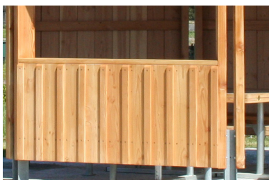
Detail - Brüstung-Deckelschalung

Sechseckpavillon, Ø 6,00 m ohne Wände, Brüstungen und Bänke Art. Nr. 51 1660 0000 Brüstung-Deckelschalung (H 80 x 85 cm) inkl. Thekenbrett 40 x 145 mm, 1 Segment Art. Nr. 51 1660 0100 Einbauwand-Deckelschalung (geschlossen) 1 Segment Art. Nr. 51 1660 0101 Einhängebank , 1 Segment Art. Nr. 51 1660 0200 bzw. 0201 Bitumenschindeln Rechteckform (bitte Farbe angeben), 48 m 2 Bitumenschindeln Biberschwanz (bitte Farbe angeben), 48 m 2