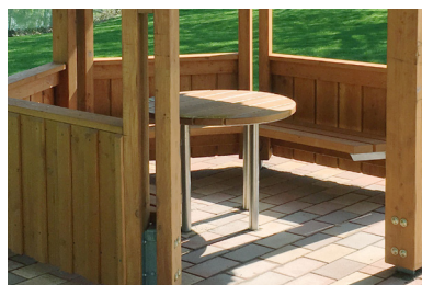
Detail - Einhängelbank