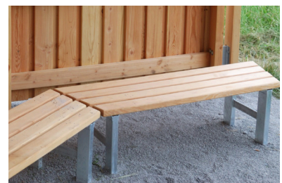
Detail - Aufstellbank