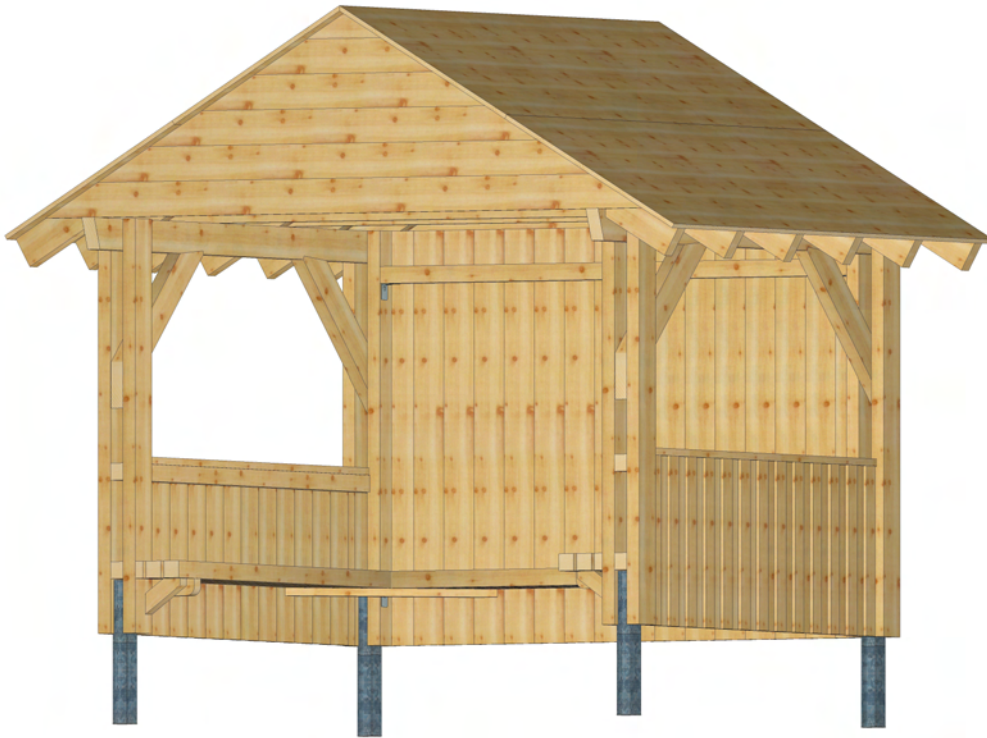
Schutzhütte "Frankfurt" aus Douglasienholz

Im Lieferumfang enthalten: 4 x Doppelständer mit IPB-Pfostenschuhen (feuerverzinkt) 12 x Sparren 1 x Dacheindeckung Dreifach-Schichtplatten 1 x Giebelverschalung 2 x Brüstung mit Deckelschalung und Thekenbrett 1 x Einbauwand mit Deckelschalung 1 x Bitumen-Unterdachbahn 1 x Einbaubank 3-seitig