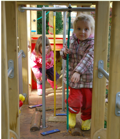
„Einstein-Zwo“ ist eine Anlage, mit der die Kinder wachsen können.