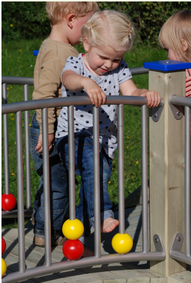
Brüstungen mit Motorikkugeln: An unseren Spielgeräten gibt es vieles zu Greifen und zu Begreifen.