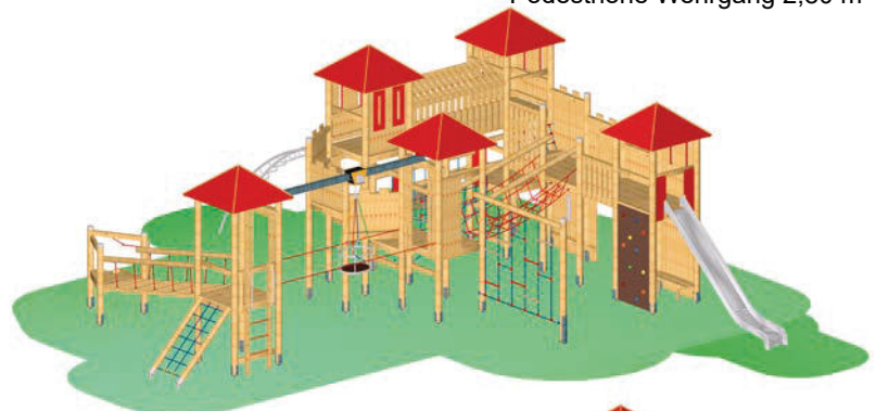
Podesthöhe Wehrgang 2,80 m