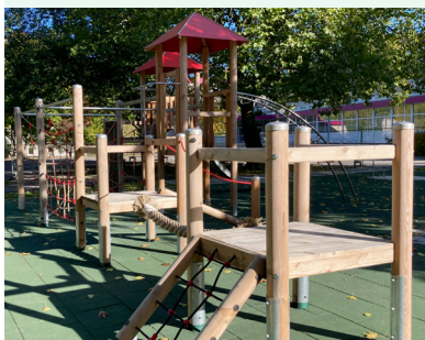
Eine Spielkombination zum Balancieren und Klettern gleichermaßen.