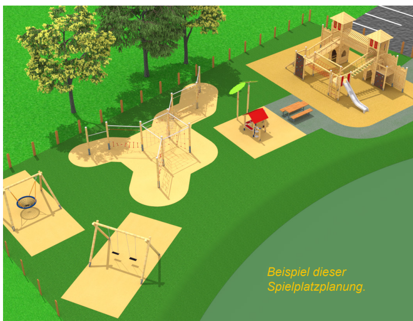
Beispiel dieser Spielplatzplanung.