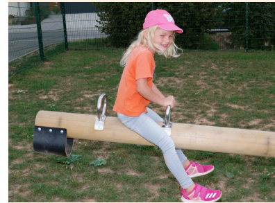
Rundholzbalken D = 160 mm Haltegriffe aus Edelstahl