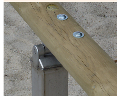
Untergestell: In verzinkter Stahl-Ausführung