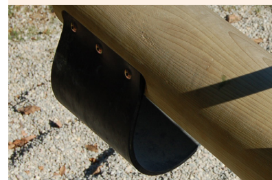
Stoßdämpfer: aus textilverstärktem Gummi