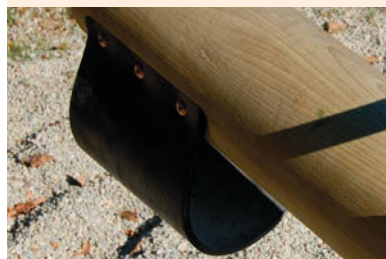
Stoßdämpfer: aus textilverstärktem Gummi