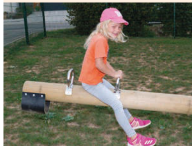
Rundholzbalken D = 160 mm Haltegriffe aus Edelstahl