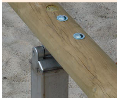
Untergestell: In verzinkter Stahl-Ausführung