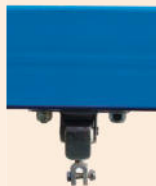
Aufpreis für Querträger blau pulverbeschichtet.