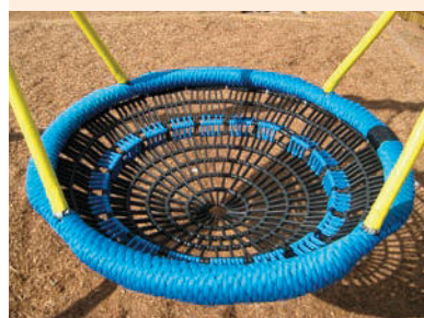
„Bewährte Qualität“ Beschreibung Nestkörbe Seite 92