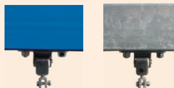
Wahlweise: Träger verzinkt, oder blau pulverbeschichtet.