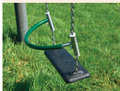
Stahlbügel als Absprungsicherung