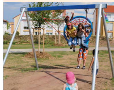
Nestkorb mit Netzmatte Aufhängung mit drahtverstärkten Seilen