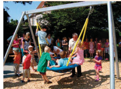
Nestkorb mit Gliedermatte Aufhängung mit schlauchüberzogenen verzinkten Ketten