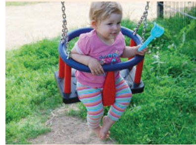
Aufpreis für Kleinkindersitz statt Brettsitz