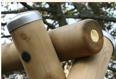
Kraft- und formschlüssige Verbindungen.