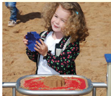
„Schaut mal, ich hab‘ einen Kuchen gebacken.“