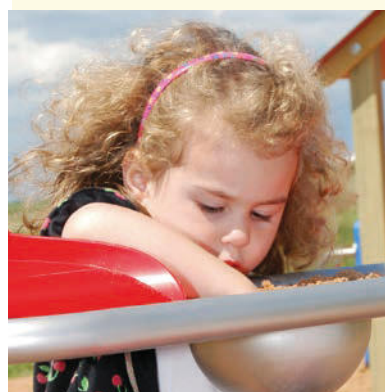
„Hier lasse ich Wasser und Sand durchrieseln.“