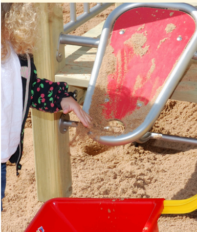
Eignet sich hervorragend zum Befüllen von Sandeimern, Schubkarren und Sandfahrzeugen.