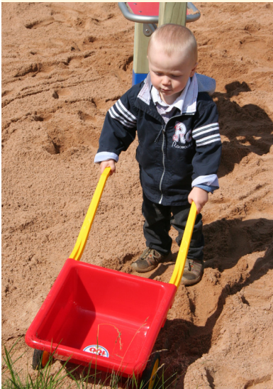
„Ich hole die nächste Ladung Sand.“