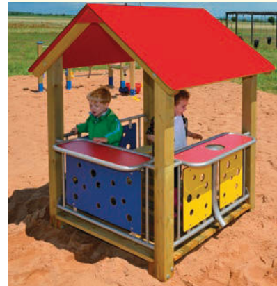
Das Sandspielhaus sollte im oder am Sandkasten eingebaut sein.